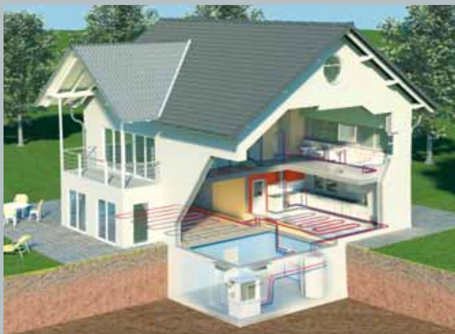
Innenaufstellung einer Wärmepumpe AEROTOP T

Bei der Heizungssanierung in bestehenden Gebäuden ist vieles vorgegeben. Deshalb ist es von Vorteil, dass die AEROTOP T bei der Innenaufstellung anpassungsfähig ist. Unterschiedliche Anschlussmöglichkeiten für die Luftführung eröffnen eine Lösung bei der Wahl des Aufstellungsortes. Die geringe Bauhöhe, die optimal abgestimmte Kälte-technik, der integrierte Elektroheizeinsatz (bis zur T16) sowie niedrige Betriebsgeräusche sind weitere Vorteile der AEROTOP T Wärmepumpe.