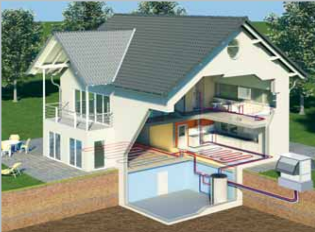
Außenaufstellung einer AEROTOP T Wärmepumpe

AEROTOP T Wärmepumpen arbeiten effizient: Durch den Einsatz von 1 kWh elektrischer Energie werden im Durchschnitt mehr als 3 kWh Heizenergie erzeugt. Dieser hohe Wirkungsgrad wird insbesondere in Kombination mit Niedertemperatur- oder Fußbodenheizungen erreicht. Und auch optisch machen AEROTOP T Wärmepumpen einen starken Eindruck. Das ansprechende Design unterstreicht das solide und zeitlose Erscheinungsbild.