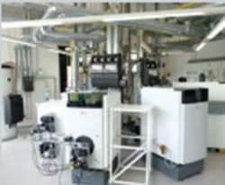
Hechingen Hohenzollernstraße 31 72379 Hechingen