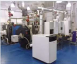
Pirna Herbert-Liebsch-Straße 4 a 01796 Pirna