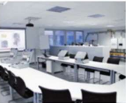
Hamburg Oststraße 58 22844 Norderstedt