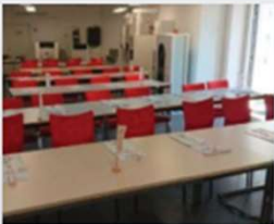
Frankfurt Dreieichstraße 10 64546 Mörfelden-Walldorf