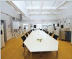
Augsburg Am Mittleren Moos 36 86167 Augsburg