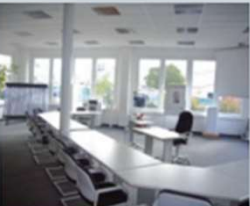
Nürnberg Vogelherdstraße 1 91227 Leinburg-Diepersdorf