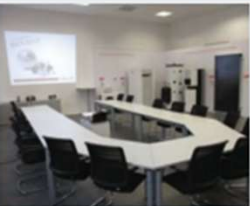
Erkrath Mettmann Straße 25 40699 Erkrath