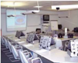
Hannover Schachtebeckweg 5 30165 Hannover